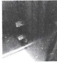
PLÁSTICOS PEQUEÑOS Pinzados entre el marco y la puerta

ESTOS MÉTODOS AVISAN AL DELINCUENTE DE QUE LA VIVIENDA ESTÁ SIN MORADORES